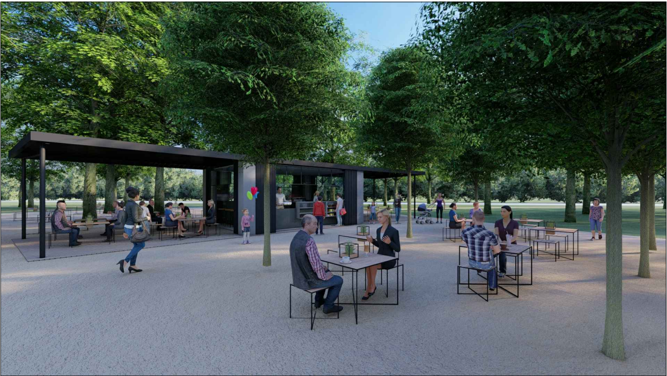
Vizualizácia, materiálové a hmotové riešenie.